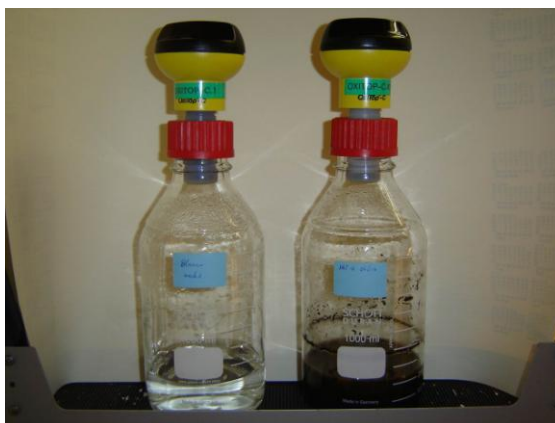
Figuur 1: Foto van een gesloten respirometer met drukmeetkop en adapter