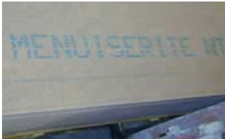
Figuur 1: menuiserite, asbestvrij