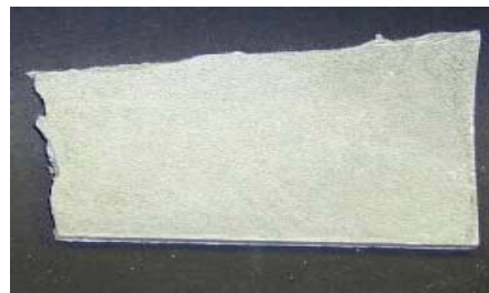
Figuur 5 en Figuur 6: breukvlak met fijnere vezels (asbestvrij)