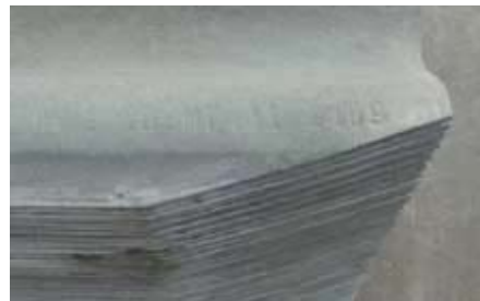
Figuur 2: golfplaten, asbestvrij