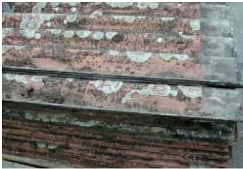
Figuur 8: asbesthoudende golfplaten

Asbestvrije producten hebben daarentegen een veel egalere kleur (Figuur 2).