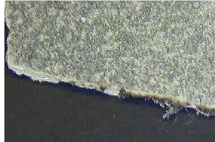
Figuur 3 en Figuur 4: breukvlak met asbestvezels

Asbestvrije producten hebben daarentegen veel fijnere vezels op een breukvlak.