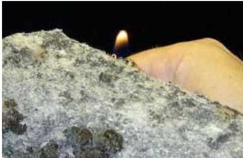
Figuur 7: opgloeiende asbestvezel

Andere vezels zijn meestal organisch en smelten weg of verliezen hun structuur bij verhitting met een aansteker.