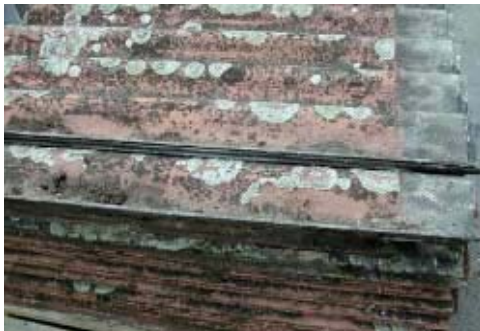
Figuur 8: asbesthoudende golfplaten

Asbestvrije producten hebben daarentegen een veel egalere kleur (Figuur 2).