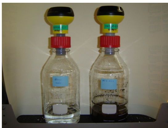
Figuur 1: Foto van een gesloten respirometer met drukmeetkop en adapter