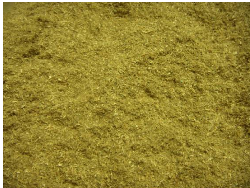
Figuur 3: Houtafval verkleind < 1 mm