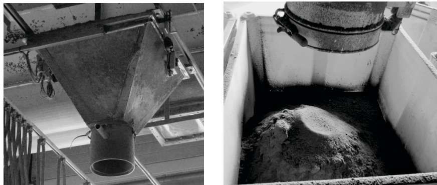
Figuur 1: locatie van wraklozing met opvang in bak