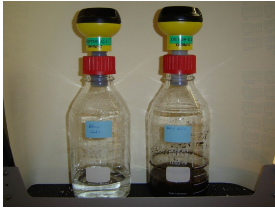
Figuur 1: Foto van een gesloten respirometer met drukmeetkop en adapter