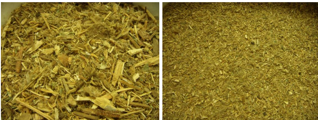
Figuur 2 Links: Houtafval (0-15 mm); Rechts: Verkleind < 2 mm