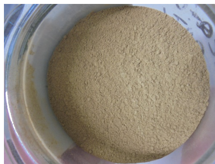
Figuur 3: Houtafval verkleind < 250 µm