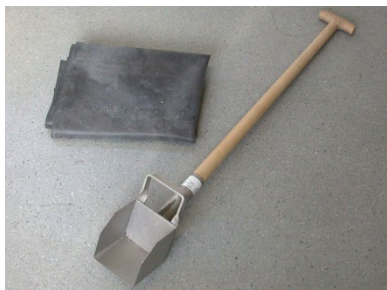
Figuur 1: bemonsteringsschep met rechtopstaande rand