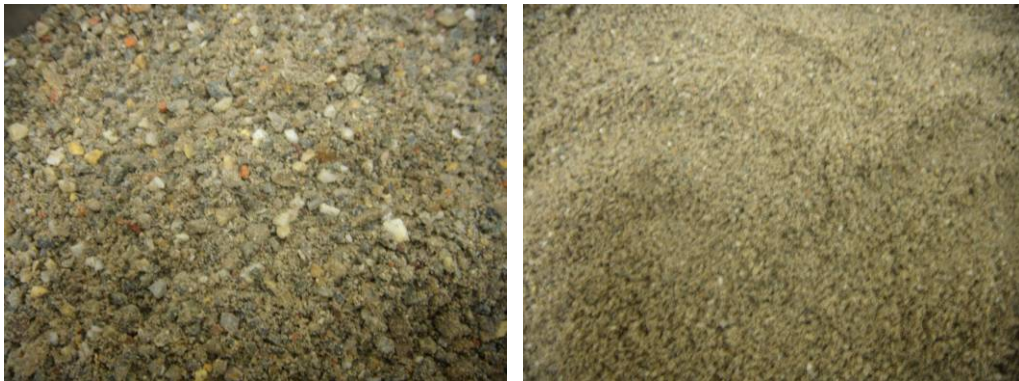
Figuur 4 Links: Gemalen betonpuin < 4 mm; Rechts: gemalen betonpuin < 1 mm