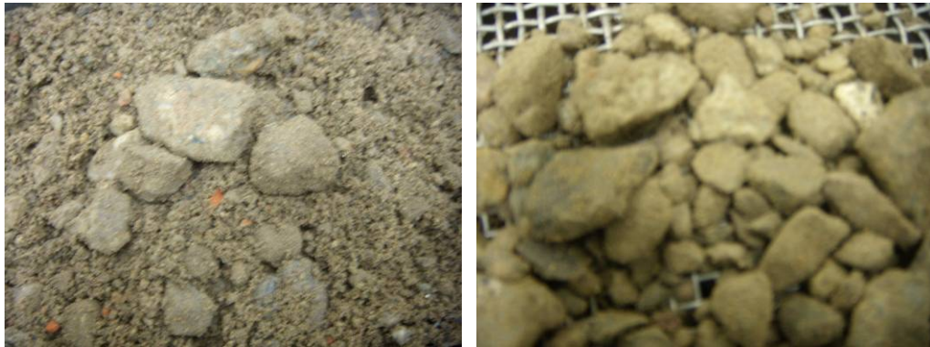
Figuur 3 Links: Betonpuin (0-20 mm); Rechts: zeefrest betonpuin groter dan 4 mm